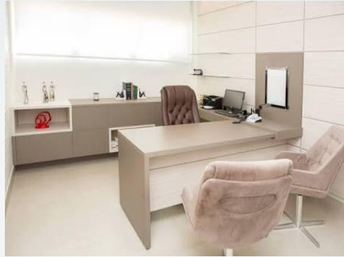
ÁREA DE INTERROGATORIO