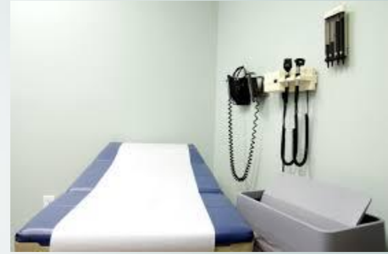
ÁREA DE EXPLORACIÓN